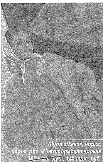
Шуба «Джаз», норка, торг. ряд «Новоторжская норка» 185 тыс. руб., 145 тыс. руб.

Новоторжская норка - собственный бренд Новоторжской ярмарки. Пошив этих изделий - целое искусство. На производство одной шубы требуется более двух недель кропотливой работы. Для этих изделий используется отборный мех с международных пушных аукционов. Это классические и модные норковые куртки, манто, длинные пальто для женщин. Они удобны и хорошо сидят. Представлены размеры от 42 до 60. Например, полупальто «Бутон» из меха норки прекрасно сидит на женщинах до 56 размера. Цвета шуб разнообразны.